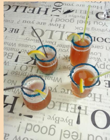
ATELIER COCKTAIL PHOTO © GEM LOGIS