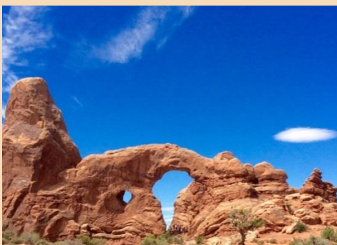
MONUMENT VALLEY LES ARCHES

Je n'étais pas partie en vacances depuis longtemps, mais cette année je suis partie avec une association parisienne (le Groupe d'Aide à la Gestion du 19 ème ). J'avais beaucoup d'appréhension à rejoindre des gens inconnus, dans un lieu où je n'ai plus mes repères. Je vois très mal et j'ai parfois du mal à marcher. Mais finalement tout s'est bien passé. Bien aidée par les accompagnants, j'ai su m'adapter aux lieux, malgré un éclairage beaucoup trop faible dans la maison. C'était en juillet, à la campagne, et j'étais avec trois autres dames, beaucoup plus âgées que moi.