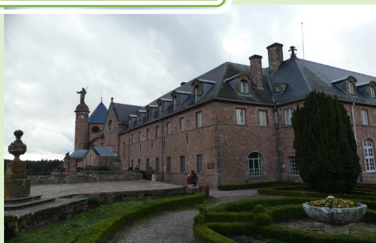
Couvent de l'abbaye de Hohenbourg