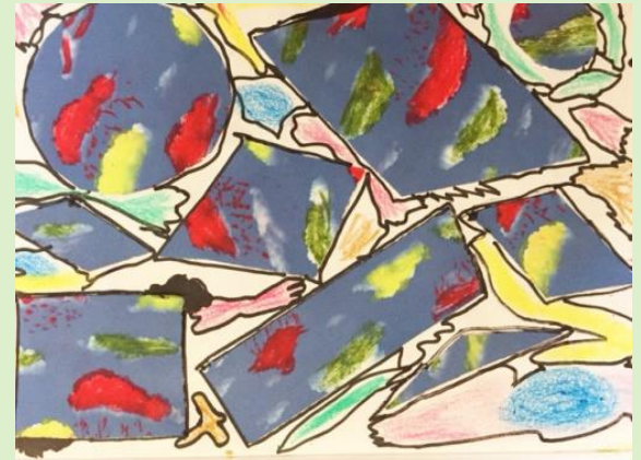
Œuvre réalisée par le GEM Versailles Yvelines

Nous attendons vos réponses à la question suivante : « Quel est mon regard sur Paris ? », publiée dans le prochain numéro. La question du numéro précédent, « Amour, gloire et beauté : qu'est-ce que j'en fais ? » en a inspiré plus d'un ! Découvrez l'ensemble de vos réponses aux pages 5 et 6.