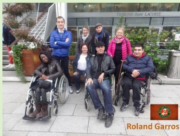
SORTIE A ROLLAND GARROS