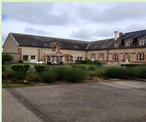
QUEL BEAU GÎTE !