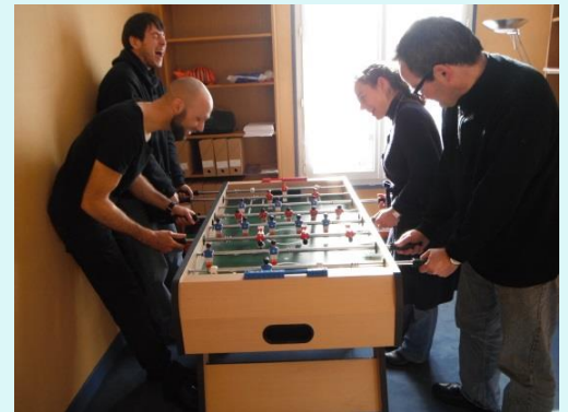
L'espace détente du GEM Versailles Yvelines