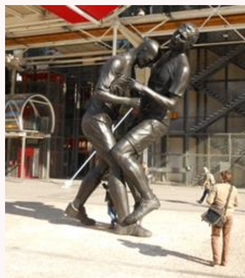
La statue du coup de boule de Zidane exposée au Centre Pompidou